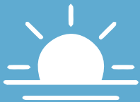
Mode 1 Good Morning

เริ่มต้นจากปัญหาที่พบ คือ โคมไฟรุ่นที่วางขายอยู่ในท้องตลาด ส่วนใหญ่ ไฟจะดับก่อนเช้า ประมาณ ตี 2 ถึง ตี 3 และไฟจะยิ่งดับเร็วขึ้นไปอีกในช่วงฤดูฝน ทาง AEC brand จึงได้ออกแบบโคมไฟ รุ่น Good Morning ขึ้นมา เพื่อให้มีแสงสว่างยาวนานจนถึงเช้า และมี Mode การใช้งานพิเศษในช่วง ฤดูฝนอีกด้วย