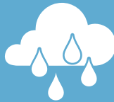
Mode 2 ใช้งานหน้าฝน